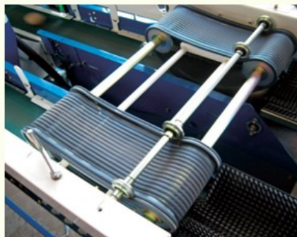
PSD-6W2に取り付けた1ベルトタイプ。 (説明のため上部カバーを外してあります)