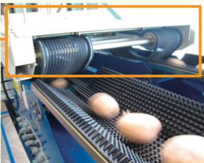
転がり防止装置。 PSD-6W2に取り付けた状態。