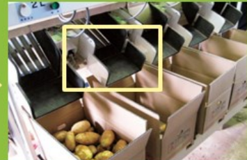
新しい箱を置いて蓋を開ける。