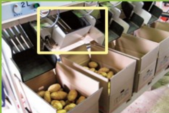
設定した重量に達すると蓋が閉じる。