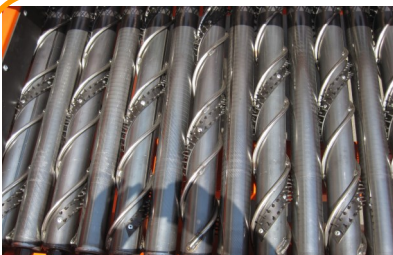
タッピングローラー部